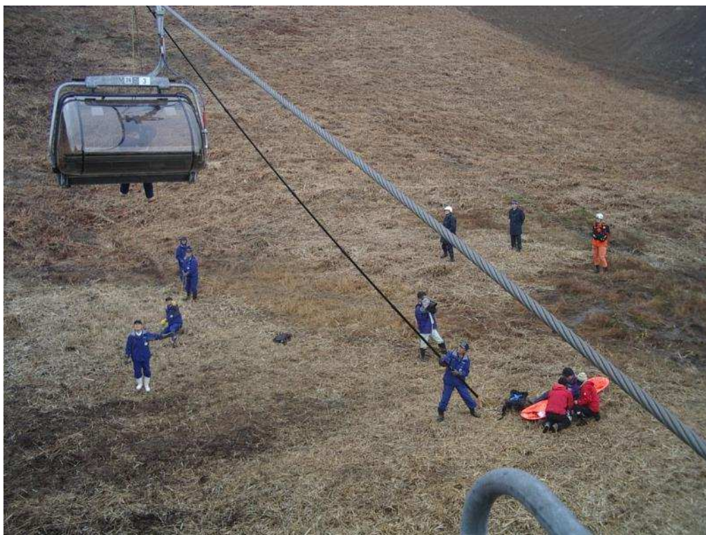
職員による緊急時の対応訓練状況